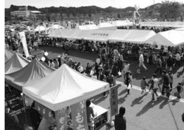
家族連れなど大勢の人でにぎわいを見せた農業祭会場

農業祭 農業祭は11月3、4の両日、一関市総合体育館前広場を会場に催されました。 会場にずらりと立ち並んだテントでは、市内各地域の新鮮な農作物や加工食品、花、植木などが販売され、来場者は出店者と盛んにやりとりしながら商品を買求めたり、飲食コーナーで名物のもち料理や岩手南牛などに舌鼓を打ったりしていました。また、パン焼きやシイタケの植菌などの体験、丸太切り、陸上自衛隊東北方面音楽隊による演奏、大東地域の峠山伏神楽保存会に