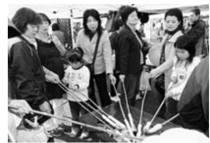
大人気のパン焼き体験コーナー。地元産小麦を使用した生地を竹に巻き、炭火で焼いて出来上がり。おいしそうなおいが立ち込めました

農業祭 農業祭は11月3、4の両日、一関市総合体育館前広場を会場に催されました。 会場にずらりと立ち並んだテントでは、市内各地域の新鮮な農作物や加工食品、花、植木などが販売され、来場者は出店者と盛んにやりとりしながら商品を買求めたり、飲食コーナーで名物のもち料理や岩手南牛などに舌鼓を打ったりしていました。また、パン焼きやシイタケの植菌などの体験、丸太切り、陸上自衛隊東北方面音楽隊による演奏、大東地域の峠山伏神楽保存会に