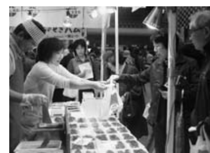
新鮮な特産品を買い求める人で、会場は連日にぎわいを見せました

やんも登場。生きているような動作に、子どもたちは「かわい」となでたり抱っこしたりして、人気を集めていました。 外には足湯体験コーナーも。会場を歩き回った来場者が気持ちよく疲れを取っていました。太鼓やよさこいによる力強い演技もまつりを盛り上げ、連日多くの来場者でにぎわいました。 よる神楽、骨寺村荘園遺跡のPR、アイデアもち料理コンテスト「もちりんピック」など多彩なイベントも催され、大勢の人でにぎわいを見せていました。