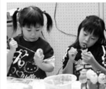
姉妹でこけしの色塗りに挑戦。お気に入りのこけしが作れるように、ゆっくりと丁寧に色を塗っていました

商工祭 商工祭は10月26日から28日までの3日間、一関文化センターを会場に催されました。 会場には地元の特産品や工芸品が勢ぞろい。姉妹都市の福島県三春町、友好都市の宮城県気仙沼市の物産と観光のコーナーも設けられ、来場者は心を弾ませながら商品を選んでいました。ステージには小中学生のものづくり体験コーナーのほか、アザラシ型知能ロボット「パロチ