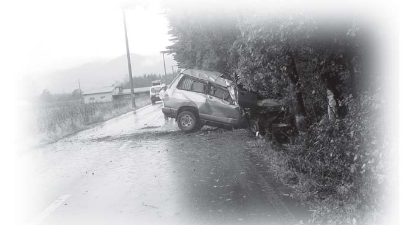
立木に衝突して車が大破。運転手は重傷を負いました(県内での飲酒運転による交通事故)