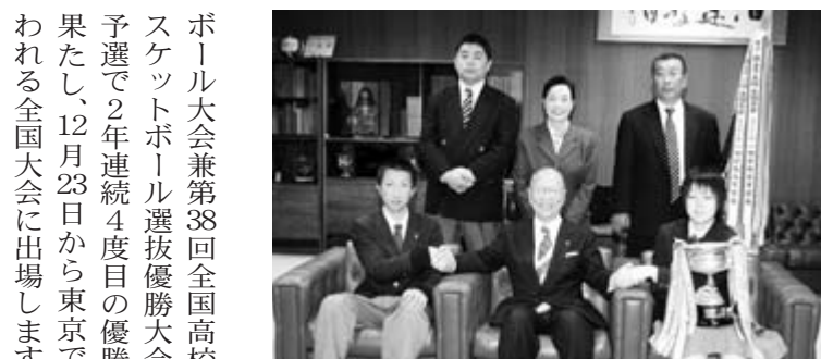
全国大会での健闘を誓った一関学院高の選手たち