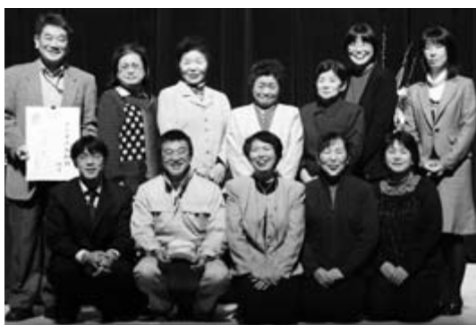
11月24日の男女共同参画講演会で、寸劇「妻の栄転、婿の憂うつ」の上演や運営スタッフとして参加した皆さん