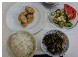
養成講座 『ロコモ予防筋肉 アップメニュー』