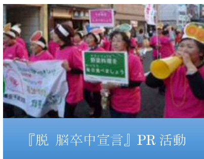
『脱脳卒中宣言』PR活動