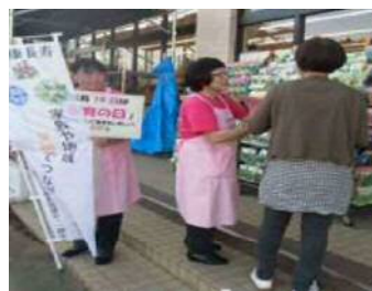
『食育の日(毎月19日)』 店頭PR活動