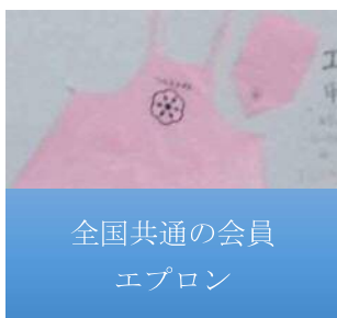
全国共通の会員 エプロン