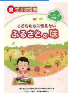
両磐の地域行事食冊子作成