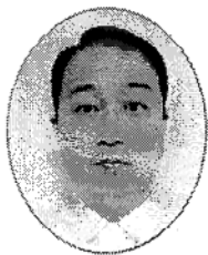
10月1日から着任する