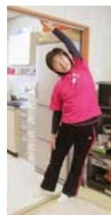
出入り口を利用して背伸び・胸そらし・胸伸ばし・背中伸ばし・片手で脇伸ばし