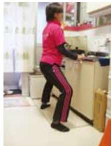
ハーフスクワット