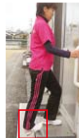
アキレス腱伸ばし