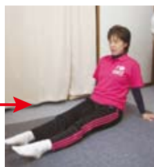
足首の曲げ伸ばし