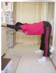
肩と太もも裏のばし