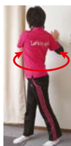
上体ひねり(左右・斜め上)