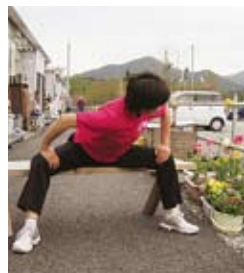
内ももと背中伸ばし