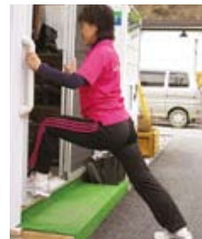
股関節とふくらはぎ