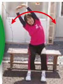
背伸び・体側伸ばし