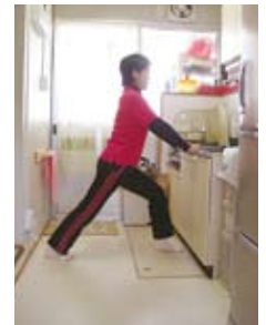
ふくらはぎ伸ばし