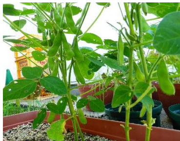
さくら組さんが植えた枝豆のさや が膨らんできました。