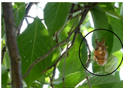
せみの抜け殻があちこちに… 誰が見つけてくれるかな。