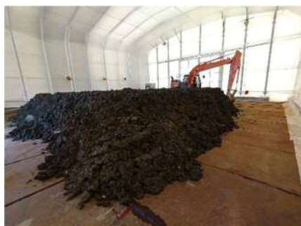
【ホットソイル処理】