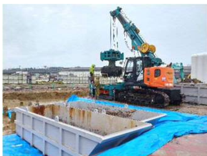
【汚染土壌掘削除去】