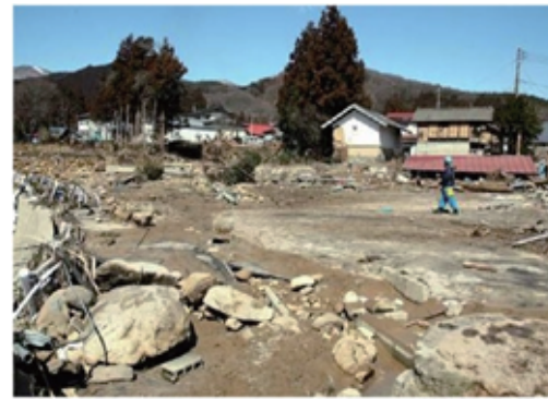
濁流が襲った藤沼湖下流の集落