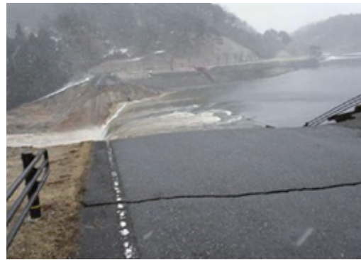
決壊直後の藤沼湖

このハザードマップは、ため池が決壊した場合に想定される浸水区域を予測し地図化しており、皆さんが安全に避難するために必要な情報が記載されています。