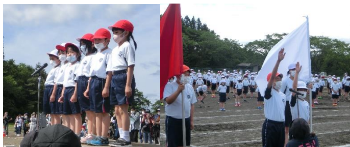
【1年生 はじめのことは 6年生 選手宣誓】

土曜日、日曜日と天候に恵まれず、5月24日(月)に今年の大運動会が開催されました。日曜日までの雨の影響で、校庭の整備作業をしましたが、まだ軟らかいところもありました。しかしながら子ども達は、太陽の下思う存分走り、演技をすることができました。保護者の皆様には、平日にもかかわらず多数お越しいただき子ども達への大きな拍手ありがとうございました。また、早朝から駐車場係や感染症チェックシート回収等をしていただいたPTA役員、地区理事の皆様にご改めて感謝申し上げます。感染症対策で多くの制限を設けざるを得ない中、ご理解とご協力にも感謝申し上げます。