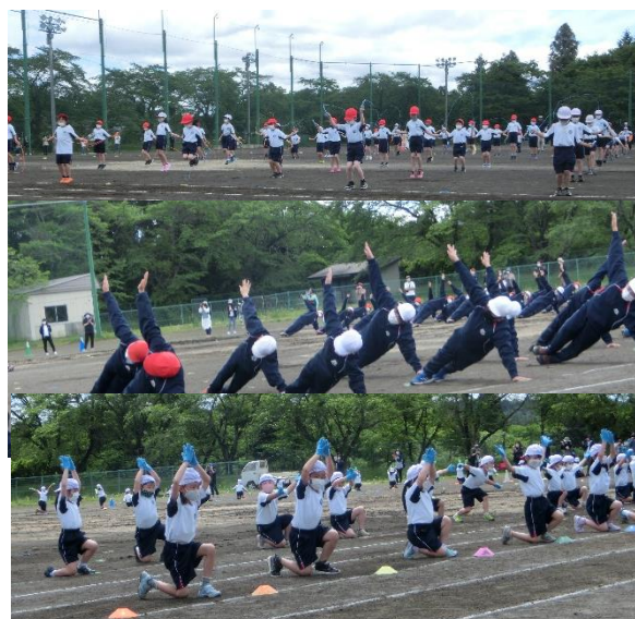
【心を合わせた各学団の表現運動】