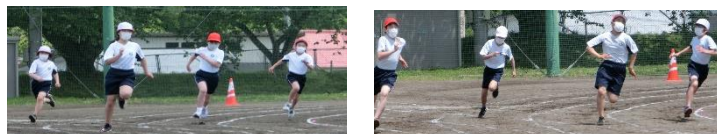
【力強い走りを見せた徒競走】

また、感染症対策のため各学年の表現運動の際には、保護者の皆様が密を防ぐため、隊形を工夫し校庭四面からご覧いただけるような工夫もしました。