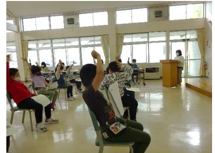
児童会総会 民主主義の根幹を養成しています。