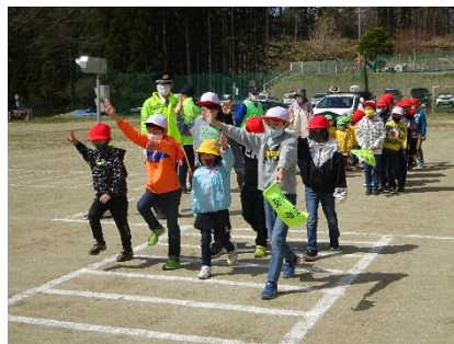
交通安全教室 基本は正しい歩き方とわたり方 右・左・右 オーケー。