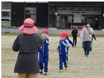
避難訓練 ハンカチ常備で「お・は・し・も」厳守！