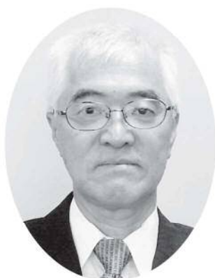
千葉委員 (職務代理者)