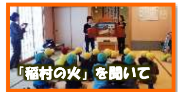
「稲村の火」を聞いて