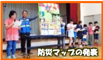
防災マップの発表

中里まちづくり協議会の主催による防災訓練が、中里市民センターを会場に開催されました。今年度は、約70名の児童が、各家庭から直接市民センターに避難（集合）しました。