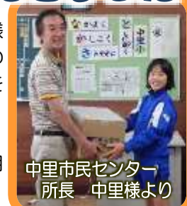
中里市民センター 所長 中里様より

いただいた図書は、中里市民センター分館として配架し、できるだけ早く子どもたちの手元に届ける予定です。沢山活用するよう促して参ります。ありがとうございました。