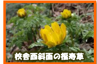
校舎西斜面の福寿草

家の中で過ごすことが多く、生活リズムが崩れがちではないか… 身体を動かすことが少なく、体力が落ちているのではないか…等、心配が募りますが、4月の始業式には、元気に登校できるよう、よろしくをお願いいたします。