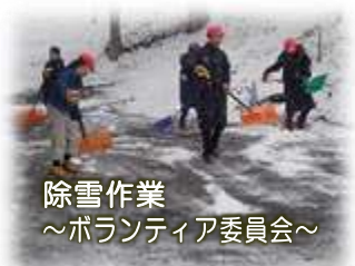
除雪作業 ～ボランティア委員会～

保護者・地域の皆様と課題を共有しながら、職員一同力を合わせて、よりよい「なかさとの子」の育成に努めてまいりたいと思っておりますので、今後ともどうぞよろしくお願ひいたします。