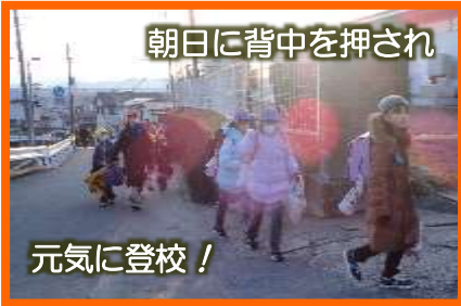
朝日に背中を押され