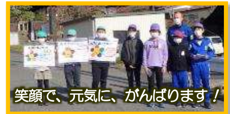
笑顔で、元気に、がんばります！

日々、落ち着いて学習を進めている子どもたちの様子を見ると、報道されるような危険が迫っていること等、忘れがちになってしまいますが、今後も一つ一つの取組を吟味しながら進めて参ります。まだまだ、新型コロナウイルス感染症の収束の見通しがつかないため、これからも行事の運営や、日程に関わる急な変更等、いろいろな面で保護者の皆様にはご面倒をおかけいたしますが、ご理解とご協力をお願いいたします。