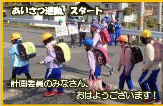
あいさつ運動、スタート