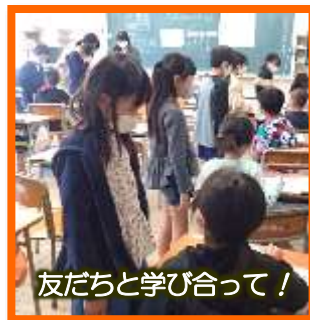
友だちと学び合っ！

算数の学習では、「自分たちで見出した課題について、自力解決（自分で考え解いてみる）し、それをグループやクラス全体で学び合い、よりよい考え方や解き方を導き出し、その方法を使って練習し、定着を図る」学習過程を大切にしています。特に、これ