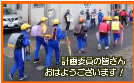
計画委員の皆さん おはようございます！

先週の五月晴がなんだったかと思うほど、曇り空の続いた今週でした。天気予報で、3月並みの気温という予報も聞こえたほど、寒い一日もありました。週初めの月曜日は、雨だけでなく、風も強く、子どもたちが登校できるか心配になる悪天候でした。そんな中を、カラフルな傘をさし、元気に登校してくる子どもたちに、感心しながら、一週間をスタートしました。