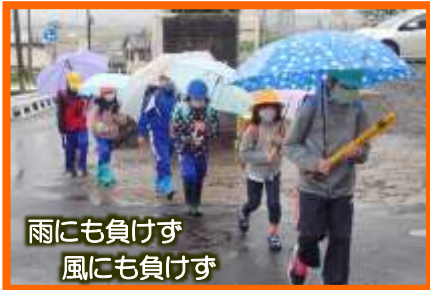
雨にも負けず 風にも負けず