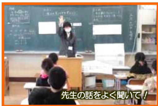
先生の話をよく聞いて！