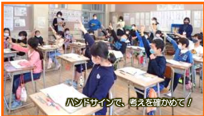
ハンドサインで、考えを確かめて！

家で宿題をする時、学校での学習の様子や内容を思い出してくれることを期待しながら、教員一同、授業改善に励んでいます。