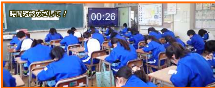
時間短縮めざして！