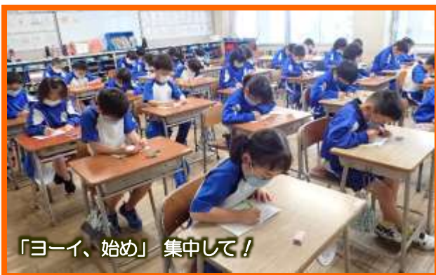
「ヨーイ、始め」集中して！