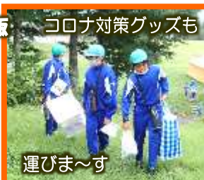
コロナ対策グッズも