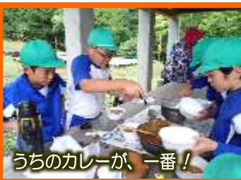
うちのカレーが、一番!