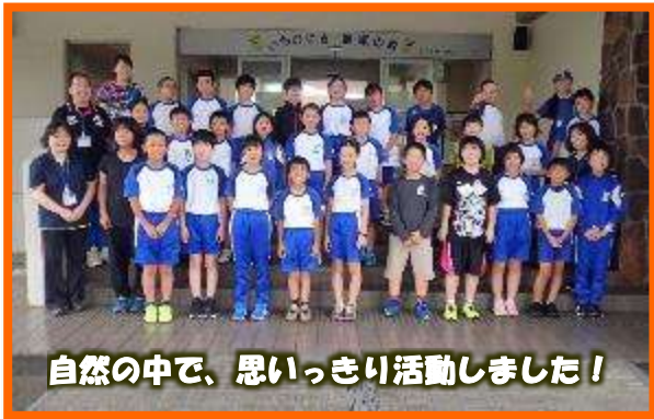
自然の中で、思いっきり活動しました!

夏休み明けの短い期間で準備をし、「仲間と共に、協力して、楽しい宿泊学習にしよう!」をスローガンに掲げ、いちのせき健康の森で学習をしてきました。