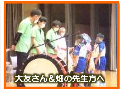
大友さん&畑の先生方へ