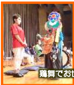
鶏舞でお世話になった皆様へ