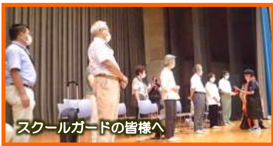
スクールガードの皆様へ

例年と時期はずれましたが、お忙しい中たくさんのお客様がご参加くださいました。まだ、年度の半分も過ぎないところですが、これまでお世話いただいたことに感謝の気持ちを伝えることをねらいに実施しました。