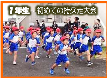
1年生 初めての持久走大会

雨雲のかかるすっきりしない天候で、実施の可否が心配されましたが、程よい日差しの中、持久走大会を実施することができました。