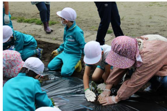
1・2年生 サツマイモの苗植え

「自然ゆたかな滝沢」について学習を行いました。実際にサンショウウオとカナヘビを見て、滝沢にも多様な生き物がいることに気づくことができました。