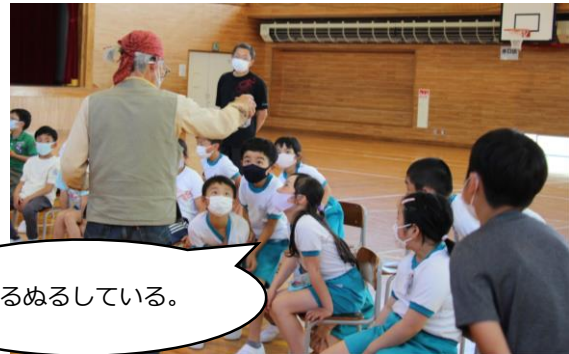
3年生 自然ゆたかな滝沢