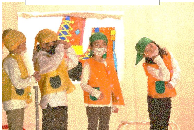
1年生 ちいさなつつやさん