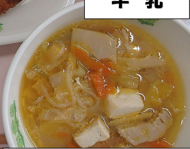
はくさい じる たけのこと白菜のみそ汁