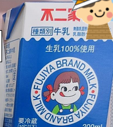
ぎゅう にゅう 牛 乳