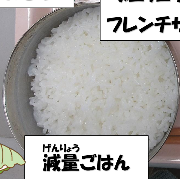
げんりょう 減量ごはん