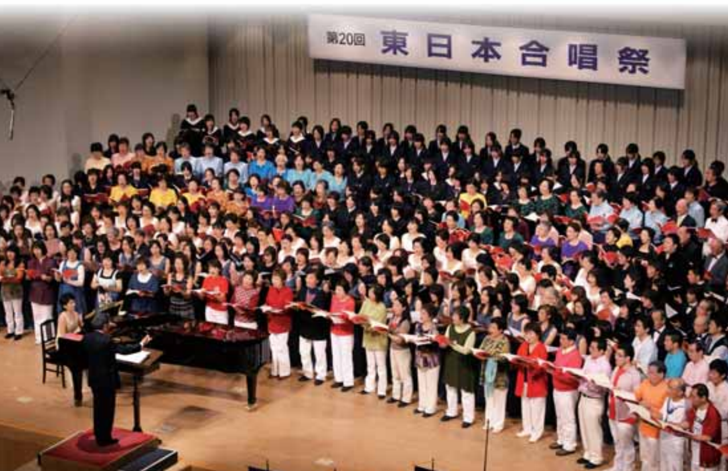
節目の20回を迎えた東日本合唱祭