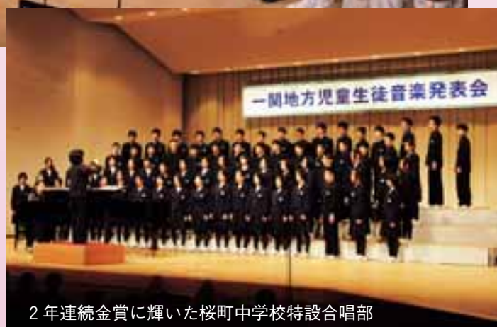
2年連続金賞に輝いた桜町中学校特設合唱部