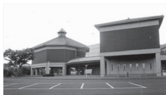
荘園絵図展が期待される博物館

質問 博物館の運営で利用者、入館者数がかかわるが、平泉の世界文化遺産登録後入館者の推移は、企画展のあり方の協議は、骨寺村荘園遺跡をもつ一関で、日本の荘園絵図を企画展示し世界文化遺産の拡張登録に関連させ情報発信させる考えは。