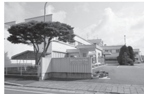
4月より外科医師が常動になった花泉診療センター

県立病院の医師確保されているか 質問 地域住民の要望に答える医師確保と配置は、どのようにされているか伺う。診療科目の充実について、どのようにとらえているか伺う。看護師は充足されているか伺う。 答弁 一関市内の県立病院の医師の配置の状況は、磐井病院51人、千厩病院7人、大東病院2人、南光病院10人、花泉地域診療センター12人となっている。医師不足解消のため、各種奨学金制度により養成された医師が、平成28年度以降に医療機関に配置される予定である。自治体の長としては、県あるいは市長会等を通じて、要請活動をしていくしかない。看護師の要請確保、定着対策、再就業の支援、資質の向上に取り組むように要請する。 一関管内の特別養老老人ホームの実態は 質問 各施設共通していることは、看護師不足と介護人材の定着率が低いことである。給与面の改善がされたが、基本報酬が削減されたため、安定した経営が難しい。平成27年度から向う3カ年の特別老人ホームの施設整備計画は、待機者に対してどのように実施していくか伺う。 答弁 第6期の募集については、3者が今回第6期の公募にあたっては応募があった状況。一関市内入所待機者917人のうち、在宅で早期に入所が必要なのは、216人である。国の方針としては、ユニット型個室の割合を高めることを目標としていて、多床室型、個室型いずれのタイプを整備するかは、建設コストや利用料の試算など、地域の実情に応じ、それぞれの法人において、検討を行うことになる。