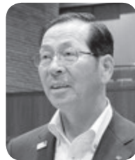
岩渕 一司 議員