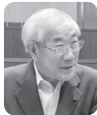
菅野 恒信 議員

答弁 身近な場所を受診できること、これまで受診しなかった方を受診につなげる掘り起しの効果も期待できることから、今後実施自治体の状況を把握しながら研究してまいりたい。