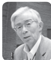
沼倉 憲二 議員