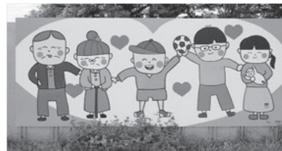
大原中学校生徒によるILC啓発看板

災害から命を守る防災教育 質問 学校における取り組みとジュニア防災検定の考えは。 答弁 指導主事が学校訪問し防災体制、学校安全計画、危機管理マニュアルなどを確認し、適切な指導を行う。今後の防災学習に生かしていく。 学校における食育の推進 質問 学校給食の地場産品の状況とすべて米飯給食にしては。 答弁 米は一関産ひとめぼれ、パンは県産小麦50%、おかずは60・6%、牛乳は地元産の原乳を使用。米飯については調査、検討し続けていく。 環境教育の取り組み 質問 市は資源エネルギー循環型まちづくりを目指している。学校教育では。 答弁 教育課程の中に環境教育を位置づけ環境美化活動や資源回収、リサイクル活動などに取り組んでいる。授業では各教科において自然への愛や畏敬の念など広く学んでいる。 NIE、新聞を活用した授業 質問 NIE（教育に新聞を）の活用状況と学校図書への新聞の配備の現況は。 答弁 昨年度は小中学校52校中51校が授業などで活用した。新聞配備は小学校7校、中学校2校。新聞活用の意義について校長会議の中で話していく。 少子化の現状と対策 質問 少子化が進んでいる。さらなる対策をどう講じるか。 答弁 毎年400人以上減少している。乳幼児から中学生までの医療費無料化など実施。キャリア教育、就職支援、地元定着など子供の成長過程に合わせた支援で少子化に歯止めをかけた。多子世帯への経済的支援について施策の中で検討していく。