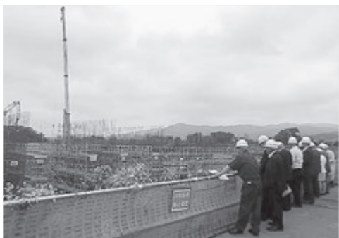
大林水門現地視察

当特別委員会では、一関市を含む6団体とともに、今年度も岩手河川国道事務所、東北地方整備局、国土交通省本省及び県選出国会議員を訪問し、治水事業の促進について要望活動を行っていく予定である。