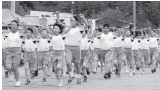
教育が明日を創る

質問 教育は人づくりであり、人づくりはまちづくりの根幹である。教育行政60年ぶりの大改革、総合教育会議の役割と大綱の策定方針を問う。 回答 総合教育会議は、教育委員長と教育長を一本化して新教育長を設置し、市長と教育委員会で構成し、大綱の作成・教育の条件整備など重点的に講ずべき施策・児童生徒などの生命、身体保護等、緊急に講ずべき措置を協議する。 大綱は教育振興基本計画・次期総合計画基本計画を基本に、対象期間を5年間とし、市が目指す基本目標を実現するため新たな位置づけのもとに教育委員会と議論を深める場ができたことは非常に意義深い。 協議の内容は。 回答 目指すべき教育の姿を議論していく。学校教育に限らず保健、医療、福祉、産業など教育に関係する施策全般を含めた課題を教育委員会と共有しながら取り組む。 質問 社会教育・生涯教育は、社会教育が補助執行という形で市長部局に移ったが、従前どおりだと認識している。 質問 学校の統廃合の中で地域の教育力が低下している。地域とのかかわり、幼小、中高、大と一貫した教育が必要だ。 回答 「未来の子供・一関」を考えた場合、管轄を超えた一貫した取り組みは重要だ。この地域で暮らす者の、この空間はすべて教育につながっている。地域全体がその中に含まれる。公開の中で、広くとらえ議論を尽くす。