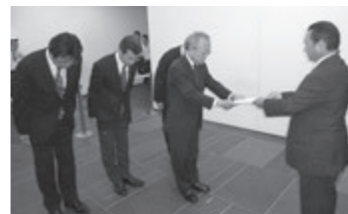
東京電力株式会社への申し入れ