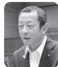
小岩 寿一 議員