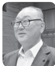
及川 忠之 議員