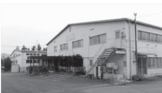
東山小新校舎予定地松川原田工業跡地

質問 東山小学校新校舎建設に係るスケジュールは。 答弁 平成26年12月東山小学校新校舎建設候補地検討委員会を設置し、校舎建設に要する面積の確保が可能な6カ所を検討した。用地取得などの条件に課題が少ない東山小学校の建て替え、東山中学校隣接地、松川原田工業跡地の3カ所に絞り込み、通学上の課題、概算事業者等について比較検討した結果、松川原田工業団地跡地がふさわしいとの提言をいただいた。今後の予定は、7月には地域の皆さんのご意見を聞き、合意形成を図りながら、地域全体の意思確認を行い最終決定につなげたい。学校統合に係る校舎の整備の国庫補助採択の要件は統合後おおむね6年以内に建設する条件の中で平成32年度の供用開始を目指していきたい。