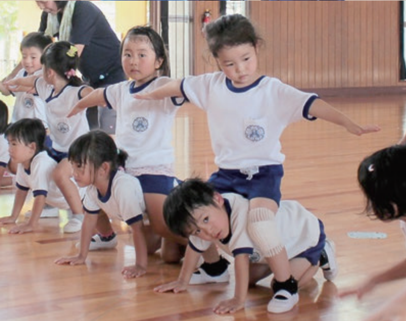
平成27年7月14日 認定こども園 花泉こども園