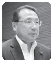
岩渕 優 議員