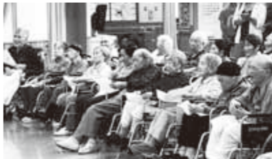
介護施設入所の皆さん