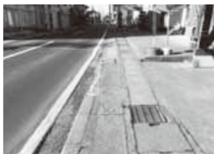
折壁町内の補修が必要な側溝や歩道

質問 新たな道路整備や道路拡張要望に対する進め方は。 回答 新たな市道整備は地域ごとに、それぞれの路線の特性や実情を把握し総合計画実施計画の中で整備計画を作成し財政状況や国の公共事業予算等を踏まえながら計画的に進める。 質問 室根バイパス開通後、県から移管される折壁町内の国道の整備はどのように進めるのか。 回答 現在県との間で移管に向けての協議を行っており、老朽化の著しい側溝や歩道の補修、車道の路面補修などの実施については、県との協議の中で要望している。