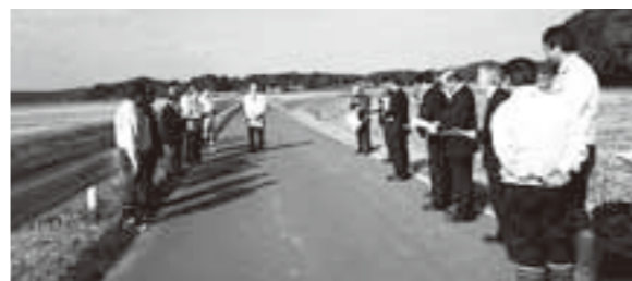
夏川地区C E建設予定地現地視察

●一関市工業振興計画について 一関市工業振興計画は、「一関市総合計画」を上位計画とする工業分野における具体的な計画である。これまでの産学官に加え、新たに金融機関を含めた「産学官金」の連携や、農商工連携などによる地域資源を生かした起業化などが盛り込まれたものとなっている。商工労働部の職員より説明を受け、積極的な意見交換がなされた。