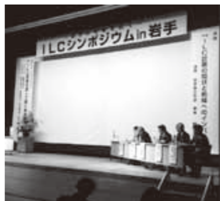
パネルディスカッションの様子