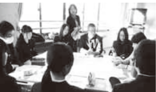
高校生による地域福祉ワークショップ