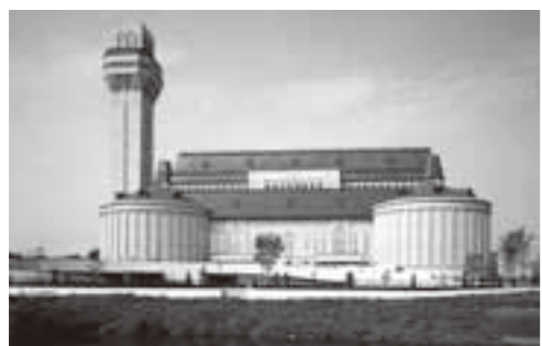
東埼玉資源環境組合 第一工場 ごみ処理施設

回答 各教科や道徳の授業において、地球規模の環境問題、生物と周囲の環境との関係、自然の恵みと災害、科学技術のあり方など幅広く学習している。防災を学ぶ岩手の復興教育についても各校で実践している。