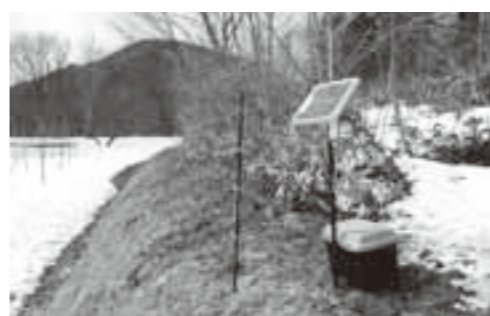
鳥獣被害対策として設置されている電気柵

質問 敗訴後の上訴に係る議会手続①市が訴えられた応訴において、敗訴し上訴（控訴及び上告）する場合の対議会手続は、市が訴えを提起する場合の議会議決に準じて対処することが至当ではないか。②今次、一関学院高校甲子園出場補助金訴訟に係る上告手続において、専決処分をした期日は。 答弁 ①地方公共団体が被告となった場合の控訴・上告に関する議決との関係する明文の規定はないが、訴えの提起に含まれ、議決事件となるの考えあり。当市もそのように解している。ただし、市長など執行機関を被告とする訴訟は、法律の根拠がないため議案として提案することはあり得ない。②この件は、訴訟当事者が市長であるから議決を要せず、専決処分の対象外。 質問 敗訴確定時には最終的に市民負担になるのではないか。 答弁 民事訴訟の場合であれば確定判決によって支払となる。 質問 人口減対策上も所得向上策こそ大切。今次国勢調査、当市人口減は県下一深刻な6千人