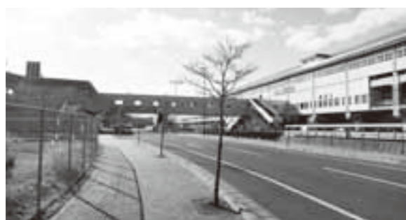
ILCを見据え、急がれる一ノ関駅東口周辺整備

質問 待機児童の状況とその要因、今後の子育て支援の取り組み課題について伺う。 答弁 平成28年11月現在86人の待機児童がいる。保育所入所要件が緩和され、ニーズが拡大し、利用定員を超える申し込みが生じている。また、保育士確保が難しく定員までの受け入れができない状況にある。子育て支援では、子供の成長過程に添った分野を切れ目なく支援していく。 質問 今日までの婚活事業の取り組みを踏まえた、今後の事業課題について伺う。 答弁 カップルは成立するが結婚に至らないのが課題。本年度から、カップルだけでなくイベント参加者全員にアンケート調査を実施し、実態の把握と事業内容の検証を行っている。また、他市町村境を越えた合同婚活パーティも催し、その成果・実績を踏まえ事業がより効果的になるよう支援していく。 質問 一ノ関駅東口自由通路を含めた、今後の駅東口整備等の考えについて伺う。 答弁 東西自由通路の整備は、