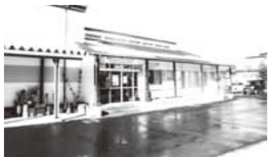
期待される真柴コミュニティセンター

質問 今度指定管理を受ける真柴コミュニティセンターの事務所は非常に狭く仕事に支障を来すので改善すべきではないか。事務室については拡張の