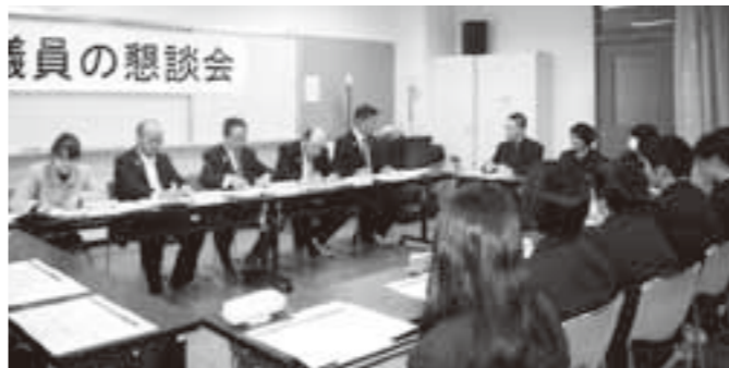
(高校生との懇談)千厩高等学校