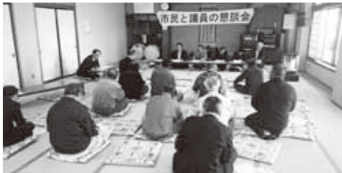
(自由参加型)藤沢市民センター黄海分館