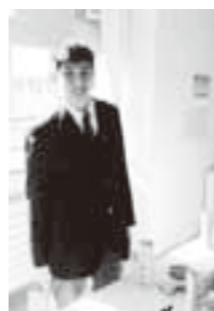
清明祭で元気に販売を担当する生徒