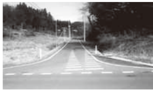
地域枠で整備された市道桜ノ沢線

質問 平成17年度合併から平成27年度までの10年間の財政運営と成果をどう総括しているのか。 答弁 住みやすさと魅力あるまちづくりのため消防防災施設の整備や保育料、医療費の無償化など、新市としての基盤づくりの財政運営を行ってきた。 質問 財政規模がふえたのは、地方債を3倍にし、建設事業を2倍にしたのが一番大きいですが、合併時点の債務は、藤沢町との合併を含めて平成27年度決算でどのようになったのか。 答弁 合併時点の1133億円が、平成27年度では388億円と減り、藤沢町分は、101億円が51億円に減少した。 質問 合併時点での基金と債務で地域枠が決まった。平成17年度の藤沢町の債務140億円が、平成27年度に51億円に減少したのは、建設事業を抑えて、債務返済した結果であると考え、今後の財政運営と地域枠を、どう対応するのか。 答弁 ニーズと財政運営を両立させ、市全体枠へのウェイトを人口割等により対応したい。