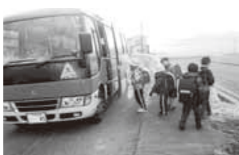
利用拡充が望まれるスクールバス

質問 平成29年度重点施策は。 回答 予算編成の基本方針と重点施策は。 質問 財政の健全性に留意しつつ、市民ニーズに的確に対応できるよう指示し、最優先で取り組む政策、施策を次のとおり示した。①資源・エネルギー循環型のまちづくり。②仕事づくり。③子育て支援。④まちづくり。⑤ILCを基軸としたまちづくり。⑥東日本大震災からの復興復興への取り組みを推進していく。また、市政を取り巻く現状と課題について、市民への丁寧な説明や情報発信に心がけ、市民と一緒に進めていくことができる予算としてまいりたい。 質問 幼児期の「ことばの時間」で、来年度からは「サントレ」手法を使わず市独自の内容とする。その狙いは。 回答 ことばの響きやリズムを楽しみ、遊びながら文字に触れ、ことばのおもしろさや美しさを感じることで、ことばの感性を高め、心の豊かさを醸成していくことが狙いであり、漢字や俳句、ことわざは覚えるのが