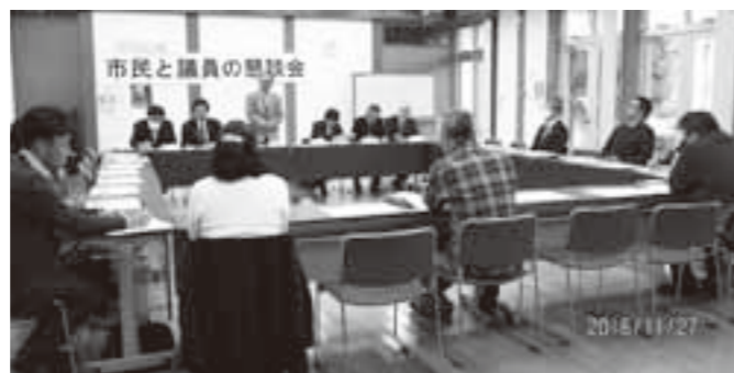
(特定団体型)一関市PTA連合会