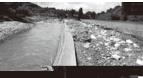
無堤の自然河川の越水状況

答弁 全庁的な取り組み体制を構築し、部局横断的な検討を行うため、総合管理計画策定委員会や検討部会も設置し、計画内容の協議を進める。素案作成後、市民の方々に組織する策定懇話会やパブリックコメントでの意見を反映させて行く。