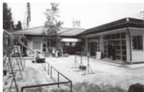
ゼロ歳児受け入れを待つ松川保育園