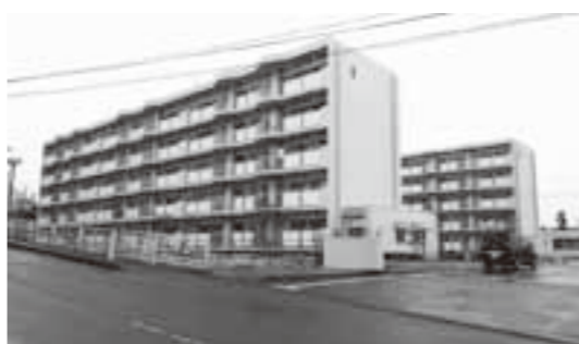
住み続けたいと希望する入居者がいる花泉西宿舎

して、要支援者支援体制づくり、防災意識の高揚を図る。 雇用促進住宅入居者の対応は 質問 雇用促進住宅入居者のうち幼稚園児、保育園児、小学生を抱えている入居者もいる。入居者の多くはそのまま住み続けたいと希望を持っている入居者が多くいる。応札がなかった場合、市としての支援策をどのように検討しているか。 回答 現在再入札条件等について検討している真つ最中、公表というか示せる段階でなく、また足を運ぶ。結果次第で対応を検討してまいります。