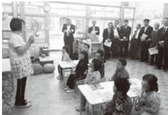
厳美幼稚園ことばの時間を視察

提出者を参考人招致し、請願の趣旨説明を受け質疑を行った後、審査を行った結果、賛成者多数で採択すべきものと決した。