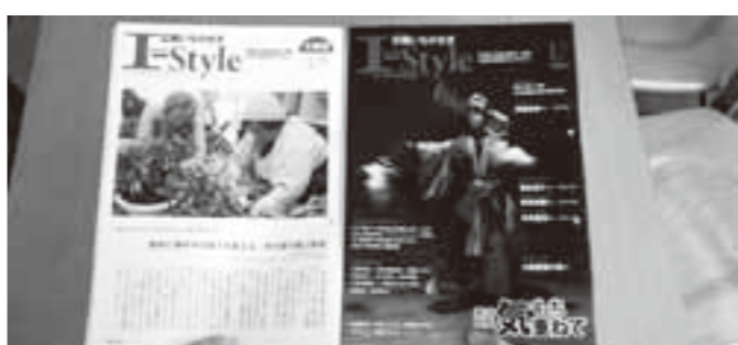
月に2回発行されている市の広報

質問 市の広報が月2回、発行されているが、これを1回にできないものか。内容はともかく、各世帯に配達する体制が多くは班長さんの負担になっていて、緊急的なものは、FMあすもや新聞等で報道されると思うので、毎月1日に発行する広報を充実して、市民の負担を軽減できないか。また、市の経費も削減になるのではないか。 回答 検討している。4月からすぐにはできないかもしれないが、近いうちにそうしたい。経費は、配送費が半分、120万円減る。印刷費（年約3000万円）は月2回を1回にしても若干増ページなので単純に半減にならない。 質問 焼却炉の建設に、精力を使うより、燃やさないで分別して処理する方向に力を注ぐべきだ。今でも、分別に市民は行政に協力しているが、市はこの流れを促進活用すべきだ。3R運動を推進することはもとより、金属類は事前に回収し、生ごみ類は大型、中型のバイオトイレで処理し、紙類、古着類は再生に、プラスチック・ビニール類