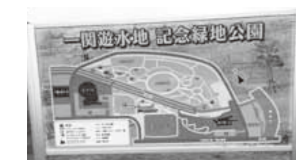
一関遊水地記念緑地公園

質問 市で管理している河川の監視状況は。 回答 地域の皆様に協力をいただきながら道路パトロールとあわせて、人家等集落のある箇所を優先して河川巡視を実施している。 質問 河川補修の要望件数と補修実施の判断は。 回答 補修工事の要望件数は、市内全域で144件あり、108件の補修工事を実施した。残りの36件は、周辺の土地に直接被害が及んでいないことから、経過観察している。補修工事は、緊急性や重要性を総合的に考慮して判断し、実施している。災害復旧工事は、別途予算計上となる。 質問 河川補修工事費を増額すべきでは。 回答 予算については、年間の河川維持予算と要望等の修繕工事の年次計画を立て、全体調整の中で予算化している。 質問 中東北の拠点都市を目指す一関市として、一関の魅力を発信する環境整備を進める意味から、国内外のイベント誘致にもつながる、市民に喜ばれる野