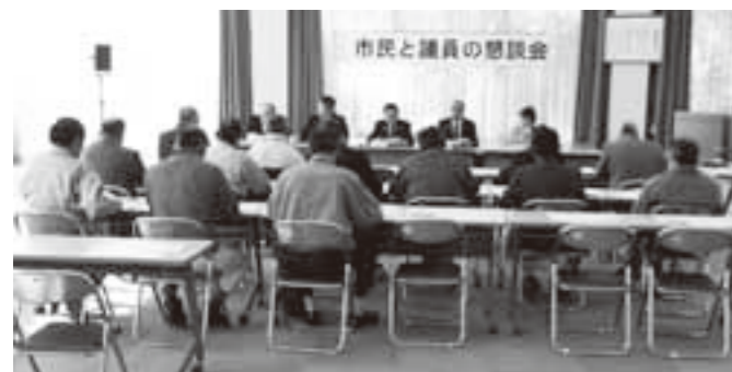
(自由参加型)室根曲ろくホール