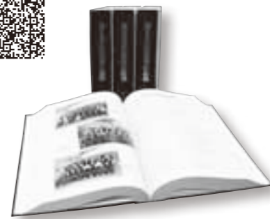
旧8市町村議会の記録