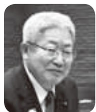
岩瀬 善朗 議員