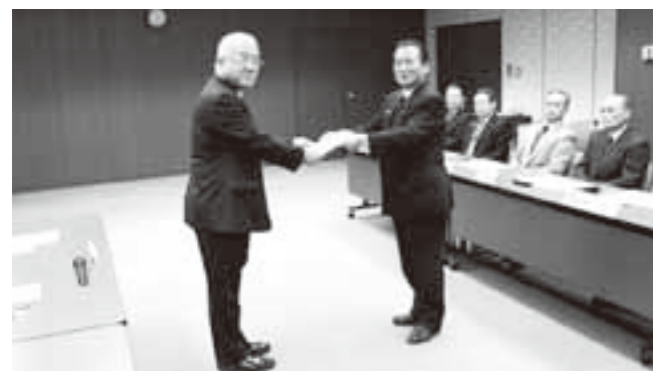
市民と議員の懇談会の提言書を市長へ

今回の懇談会開催に当たり、会場まで足を運んで、さまざまなお意見をいただき感謝申し上げます。 今回の懇談会は、昨年と同様に市内各地の20会場で、どなたでも参加できる『自由参加型』と特定の団体を対象とした『特定団体型』、そして、市内の高校、高校で開催しました。(工業高校は、今回は都合により開催せず) 皆さんから頂戴したご意見等は、次ページ以降のようにとりまとめ、12月16日(自由参加、特定団体)及び1月11日(高校生)の2回に分けて市長に提言しました。 市長からは『貴重な提言であり、今後の総合計画等のさまざまな施策に財政等を含め、総合的に検討のうえ、最大限に対応する』旨の話がありました。 議会としては、各常任委員会、特別委員会、さらに個々の