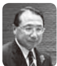
岩瀬 まさる 議員