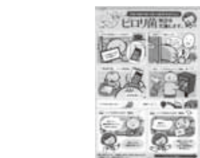
ピロリ菌検診のチラシ（花巻市）

質問 一関市の避難所運営体制は。 回答 避難所での市の役割と住民の役割については、市は施設管理や初動期の対応、資機材、物資、食料などの調達、災害対策本部への報告事務などを担当。住民組織のほうは、長期にわたる場合は避難所運営委員会が組織され、避難者が共同生活していくための必要な情報の揭示、食事関係、清掃関係、支援助物の配給等々生活に関する部分について担っていただき、相互に連携して運営するということが前提となっている。 質問 B型肝炎の定期接種は今年の10月から無料で受けられることになったが、4月、5月生まれの乳児については、1歳に達するまでに3回目の接種ができない場合が多いと想定されるが、その場合の対応は。 回答 市としては本年4月及び5月生まれの乳児が1歳に達した後でも、独自に接種費用を助成することとして、接種率の向上と保護者の経済的な負担軽減を図っていく。