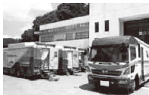
医療費適正化を目的に実施している特定健診の会場

回答 不納欠損で処理する金額を他の納税者に賦課できる、と具体的に明記されていないが厚労省からは、収納率等を勘案して予算編成するよう通知が来ている。