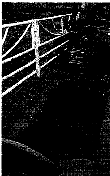
配水管漏水修繕工事の様子