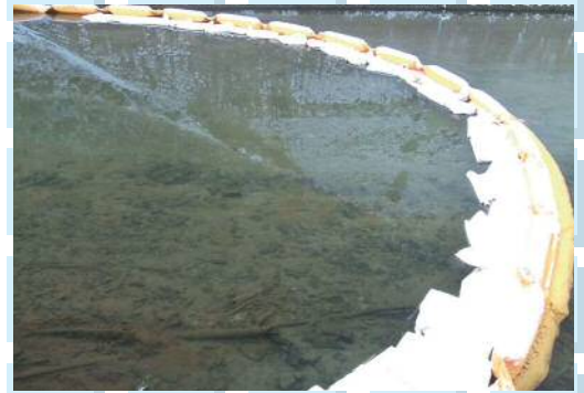
オイルフェンスの設置状況 (油の回収費用は原因者が負担しなければなりません)

岩手県内では、令和元年度に47件の油流出事故が発生しています。その多くは、配管の破損など点検管理の不備や、バルブを閉め忘れるなどのうっかりミスが原因です。油漏れで河川が汚染されれば、工業用水、上水道、農業用水の取水ができなくなり、工業団地などの生産活動や市民生活に影響が及ぶおそれがあります。