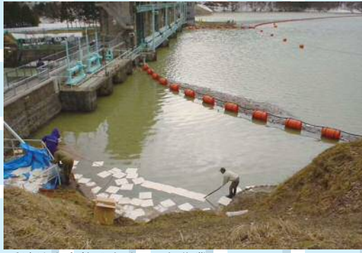
重油流出事故発生時の回収作業 (平成17年4月重油8,000ℓが流出したため、上水道と工業用水道の供給が停止しました)