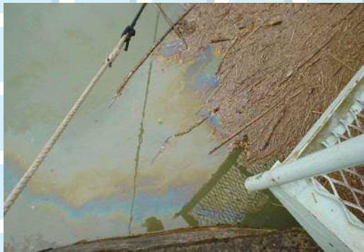
ダムに流出した油