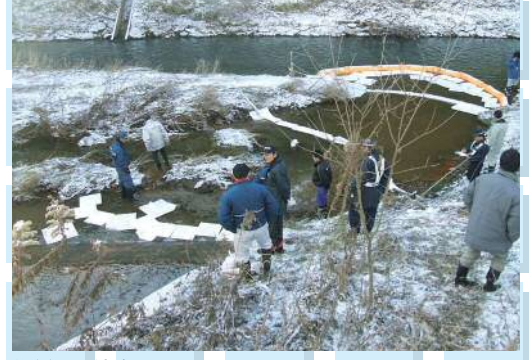
河川への流出 (油流出事故は流域の自然環境を汚染します)