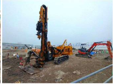
【栄養剤注入井戸設置状況】