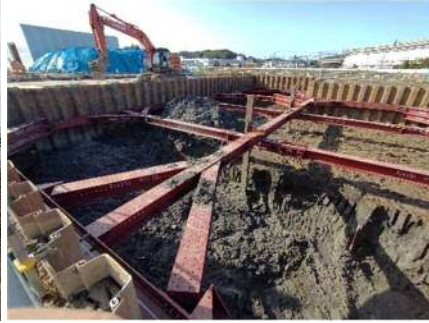
【ホットソイル処理掘削状況】