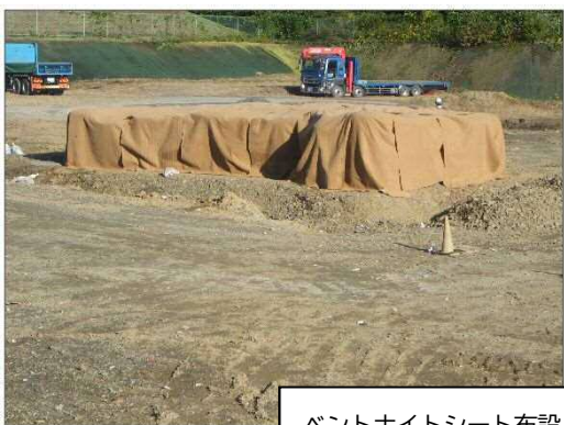
ベントナイトシート布設