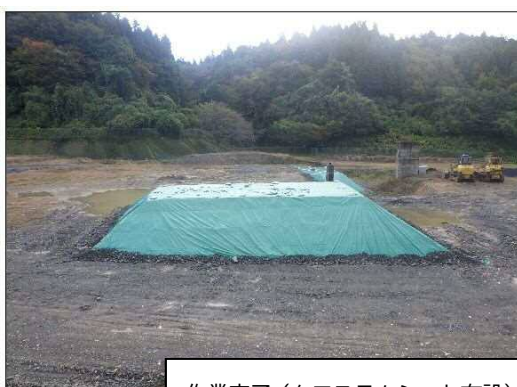
作業完了（クロスラムシート布設）