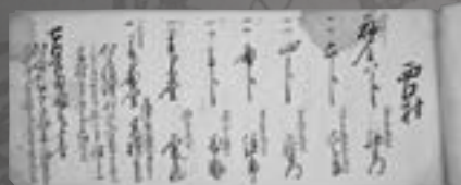
西口村の砂金上納高の書上(藤沢地域)