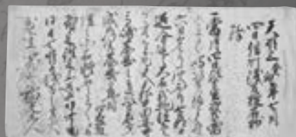
天明3年の浅間山噴火の被害を 伝える手紙(千蔵地域)