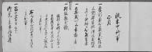
村の肝入の年中行事(花泉地域)