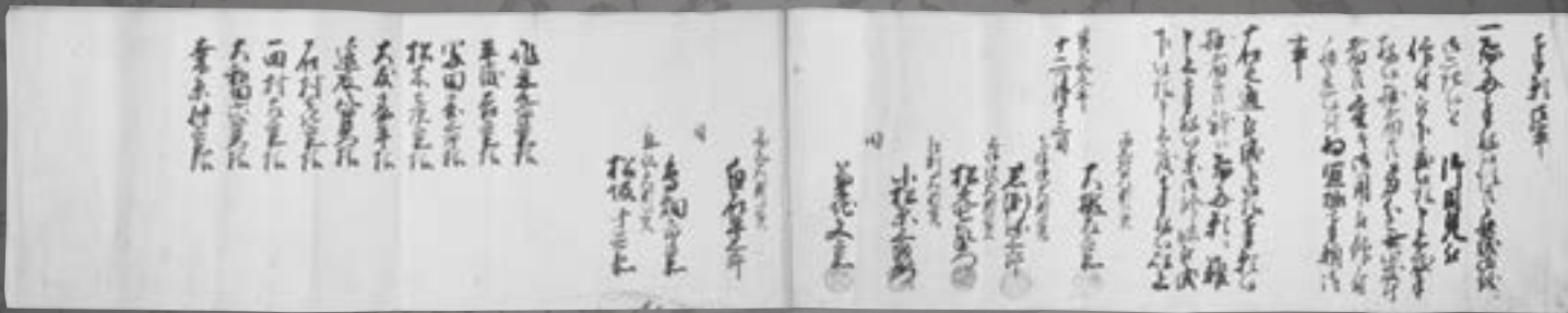
西岩井・伊沢・江刺・東山・気仙の大肝入たちの願書

※は、一関市博物館所蔵、その他は個人蔵。( )は、関係する地域、または伝来した地域