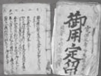
東山北方の大肝入が作成した執務記録 「御用定留」(大東地域ほか)