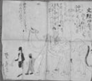
長崎で出された版画の写し(花泉地域)