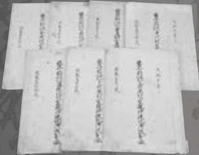
猟師と鉄砲の登録簿(大東・室根・東山・前沢)

江戸時代に村で作られた 古文書を中心にとりあげます。 足元の歴史をみつめ、 先人たちの息づかいを 感じてみませんか。