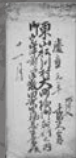
松川村の大町氏の家来の 年貢の帳簿(東山地域)