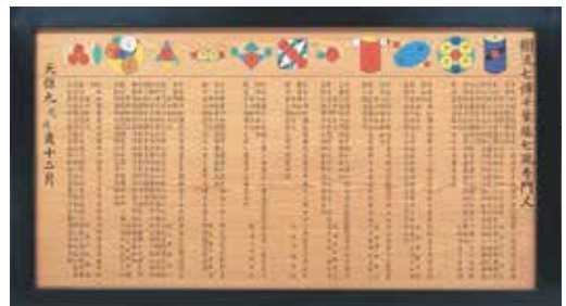
【和算】一関八幡神社算額(復元)