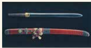
朱漆塗海老鞘巻拵・剣

「一関藩のしくみとすがた」 日時/2月22日(土) 13:30～15:00 講師/大島晃一氏(岩手県南史談会幹事長) 定員/一般100名(要申込) 参加料/無料