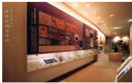
中世荘園骨寺村ブース

原始・古代から現代まで、地域の歴史の流れと特色を紹介します。中世荘園骨寺村に関する資料もブースを設けて展示しています。