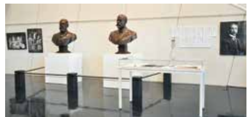
ながつぼもりよし 長沼守敬