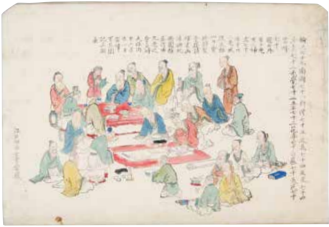
詩聖堂書画会図(「塵積成山」より)