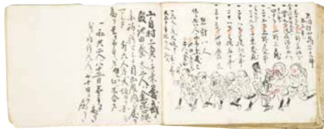
伊勢参宮日記(個人蔵)