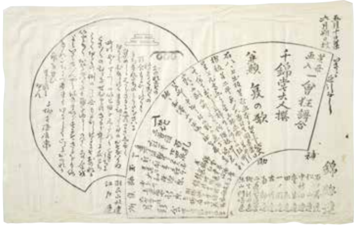
芝居画入一会狂歌合引札(個人蔵)