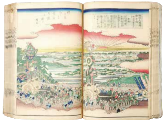
改正増補江戸大節用海内蔵