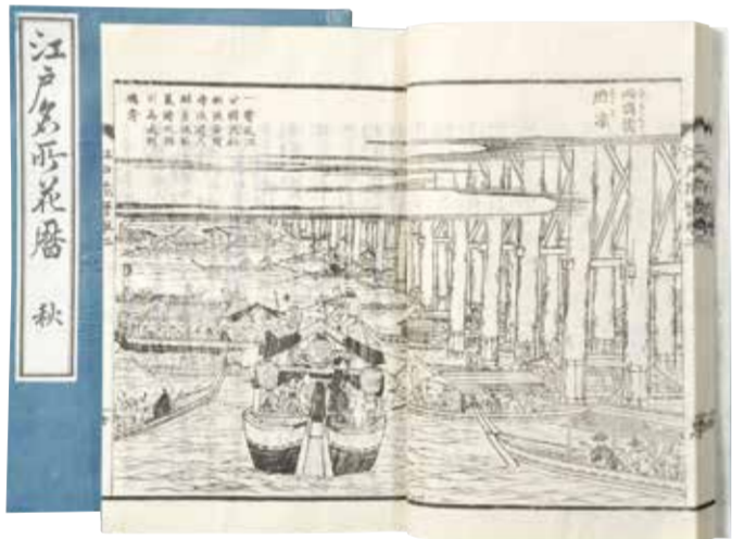
江戸名所花暦(個人蔵)