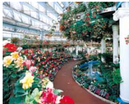
花泉：花と泉の公園