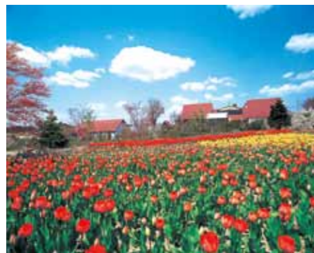
藤沢：館ヶ森アーク牧場