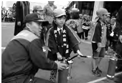
水消火器を体験した園児たち

令和元年10月24日(木)に「第7回幼年消防大会」を一関文化センターで開催し、一関市及び平泉町の23の幼稚園や保育園、認定こども園から幼年消防クラブ員の園児たちと先生や保護者ら600人以上が参加しました。 幼年消防大会は、消防・防災に関する各種体験を通じて幼年消防クラブ員の防火思想の高揚と健全育成につなげようと両磐地区幼少年婦人防火委員会と日本防火・防災協会、一関市消防本部が共催で2年に一度開催しています。