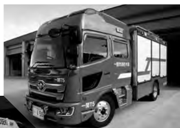
水槽付消防ポンプ自動車 (一関東消防署)