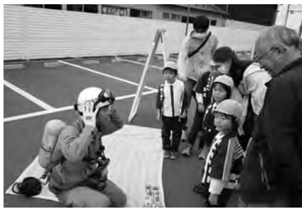
消防士が空気呼吸器の着装を披露(早業コーナー)