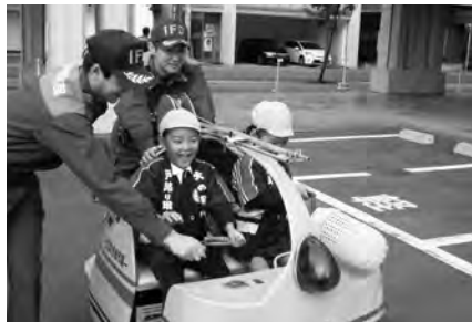
ミニ消防車に乗車した園児