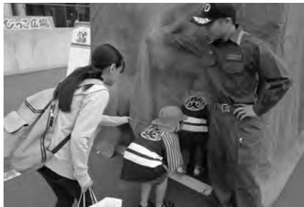
姿勢を低くして(煙体験コーナー)

令和元年10月24日(木)に「第7回幼年消防大会」を一関文化センターで開催し、一関市及び平泉町の23の幼稚園や保育園、認定こども園から幼年消防クラブ員の園児たちと先生や保護者ら600人以上が参加しました。 幼年消防大会は、消防・防災に関する各種体験を通じて幼年消防クラブ員の防火思想の高揚と健全育成につなげようと両磐地区幼少年婦人防火委員会と日本防火・防災協会、一関市消防本部が共催で2年に一度開催しています。