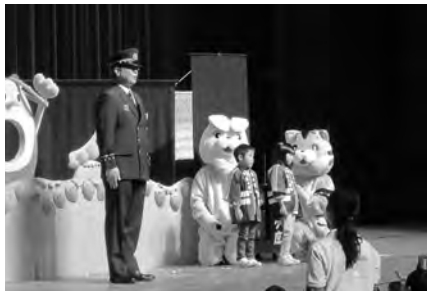
園児たちが防火の誓いを唱和

一関文化センター敷地内では、消防広場として各種体験コーナーを開設し、クラブ員の園児たちは消防車・救急車の搭乗やミニ消防車乗車、水消火器による消火などを体験しました。 水消火器を体験した園児は「きちんとできた」「(迫力が)すごかった」と笑顔で話していました。 大ホールでは人形劇を鑑賞した後、参加園児ら全員で「ほくたちわたしたち火遊びしません」と大きな声で防火の誓いを唱和しました。