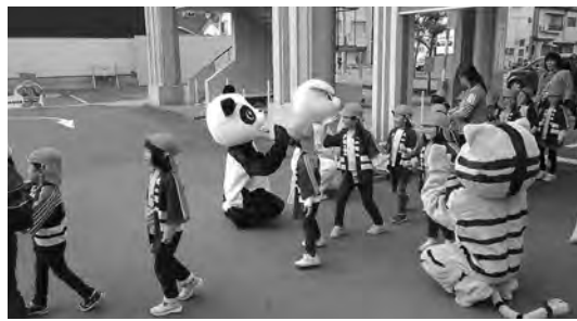
多数の園児らが参加しました