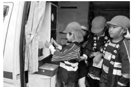
救急車を見学する園児たち