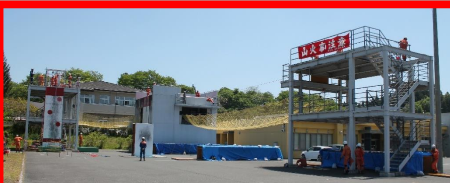
訓練会場(一関東消防署)