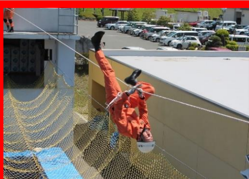
ロープブリッジ救出