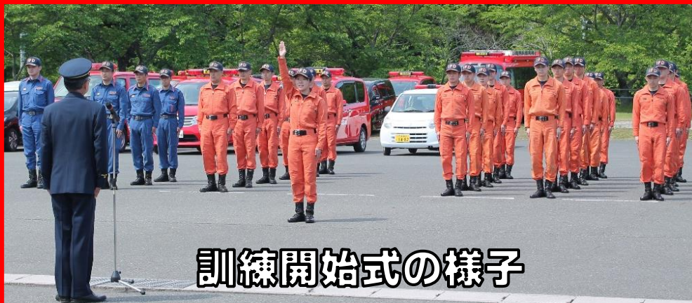
訓練開始式の様子

令和8年5月13日(水曜日)に、救助隊員による訓練開始式が行われ、岩手県大会に向けた救助訓練が本格的に始まりました。