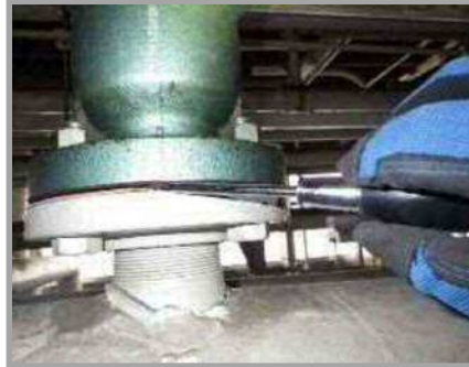
アスベスト含有が確認されている建物内配管断熱材接合部