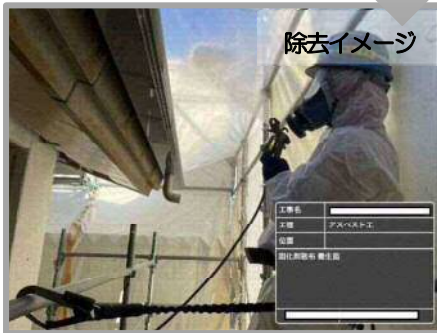
仕上げ塗材のアスベスト除去 (隔離養生)