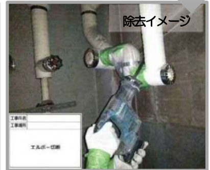
配管エルボ部のアスベスト除去