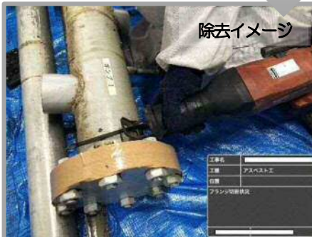
配管断熱材接合部のアスベスト除去