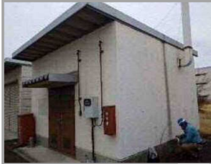
仕上げ塗材にアスベスト含有が確認されている危険物倉庫