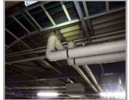
アスベスト含有が確認されている建物内配管エルボ部