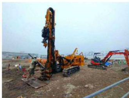
【栄養剤注入井戸設置状況】