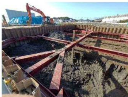
【ホットソイル処理掘削状況】