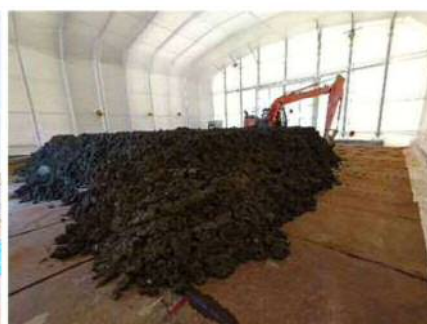
【ホットソイル処理】