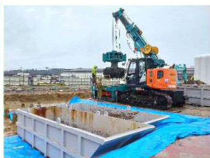
【汚染土壌掘削除去】