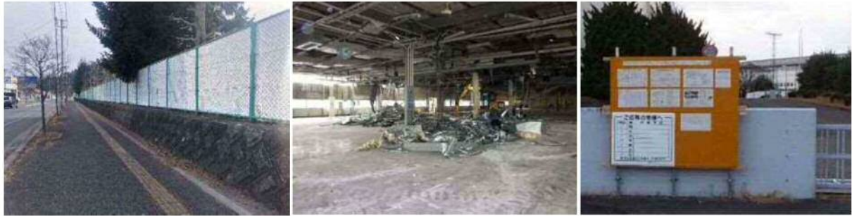
【シートによる仮囲い】