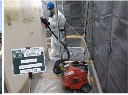
【アスベスト飛散防止対策状況】