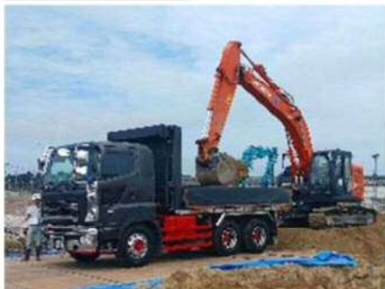
【汚染土壌の掘削除去】