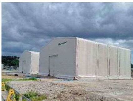
【ホットソイル処理テント】