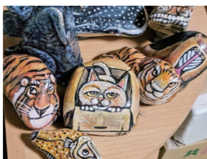
動物のストーンアート