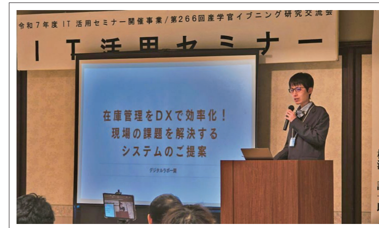
令和7年12月に開催された「IT活用セミナー」で、開発した製造業向け在庫管理アプリについて説明している様子。

自然に囲まれる環境でリフレッシュできる一方、買い物や生活にも困らないバランスの良さ!