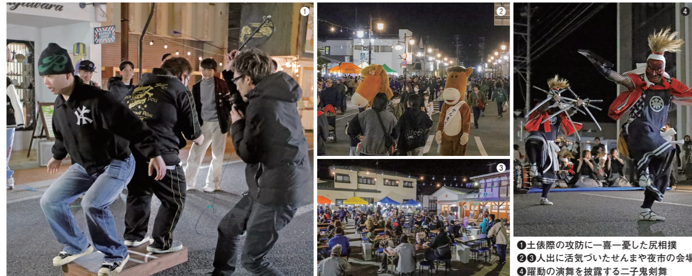
①土俵際の攻防に一喜一憂した尻相撲 ②③人出に活気づいたせんまや夜市の会場 ④躍動の演舞を披露する二子鬼剣舞