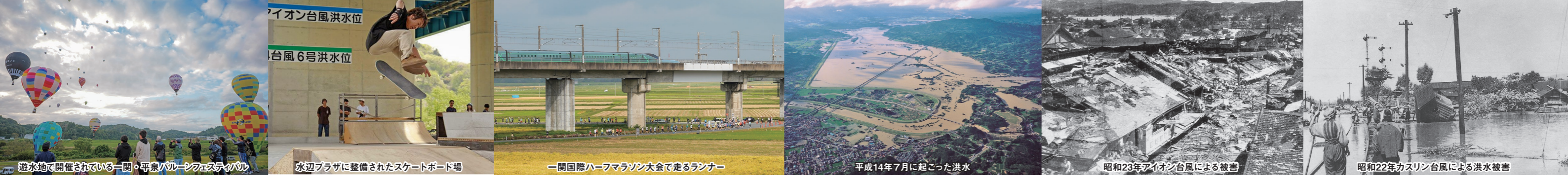
遊水地で開催されている一関・平泉バルーンフェスティバル