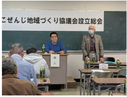
こぜんじ地域づくり協議会設立総会の様子

住民一人一人の参加と協力が、住みよい地域の実現につながります。今後も、地域活動への積極的な参画をお願いします。