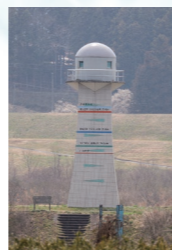
狐禅寺水位観測所