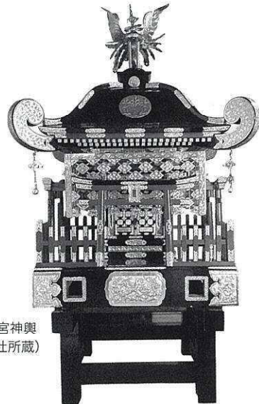
本宮神輿 （室根神社所蔵）