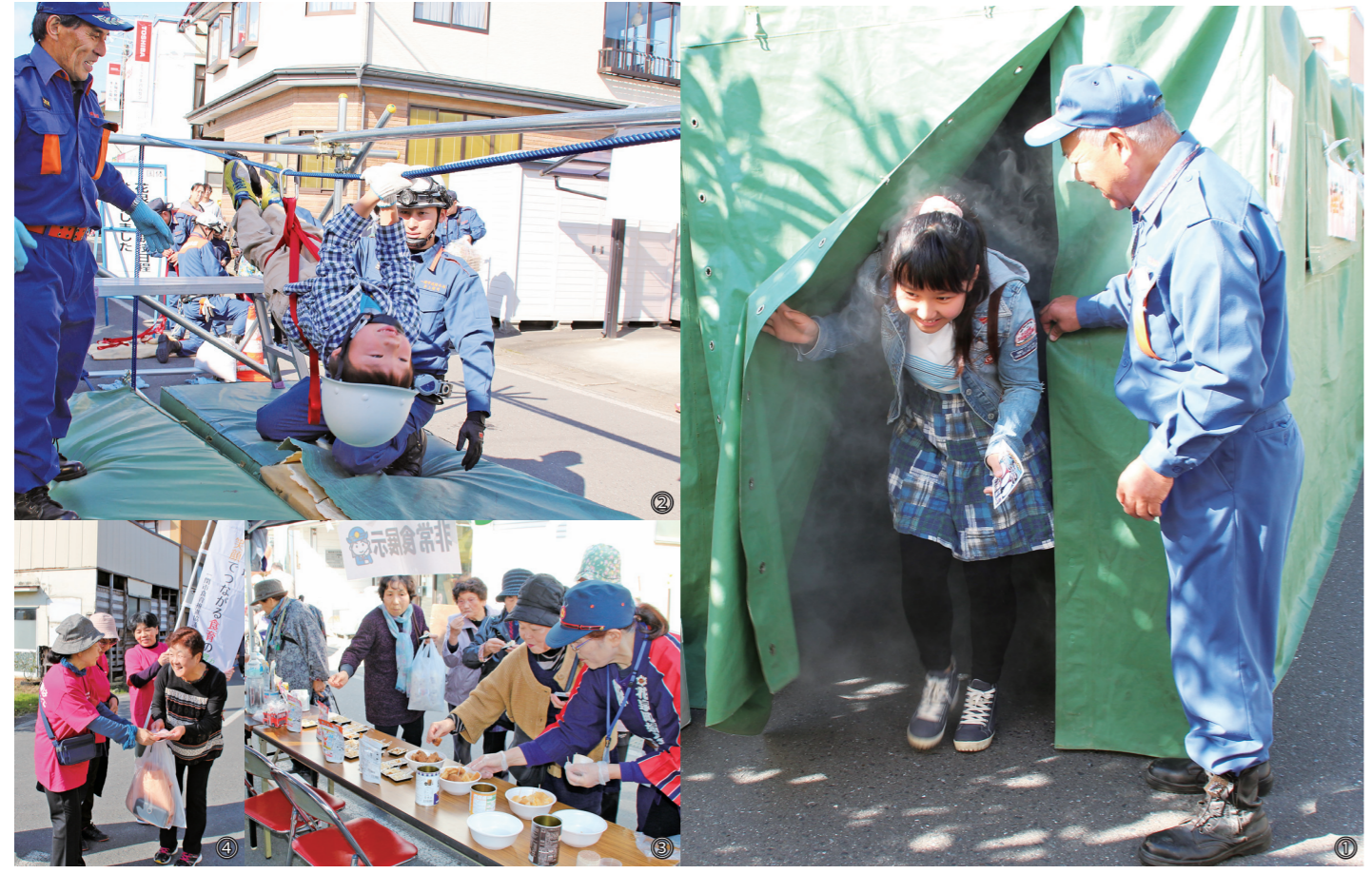
①スモークハウスで煙体験/②ロープ渡りに挑戦/③非常食を試食する来場者/④花泉地域保健推進委員・食生活改善推進員の皆さんが「がん検診」や「食育」などをPR

2017年12月15日号/発行 岩手県一関市/編集 花泉支所地域版編集課/〒029-3105 一関市花泉町涌津字一ノ町29 ☎0191-82-2211/ホームページhttp://www.city.ichinoseki.iwate.jp/印刷 岩手日日新聞社