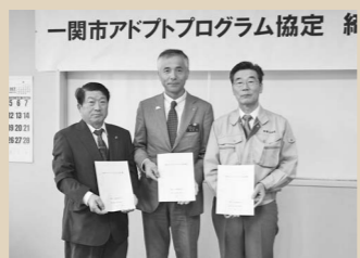
一関市アドプトプログラム協定