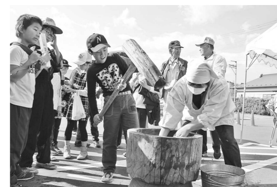
餅つきに挑戦する子どもたち

近所の友人7人で訪れたグループは、「年1回のお祭りを楽しみにして来た。皆さんの作品を見たり、おいしいお餅をいただいたりした。みんなとお祭りを楽しんでいる」とにこやかに話してくれました。