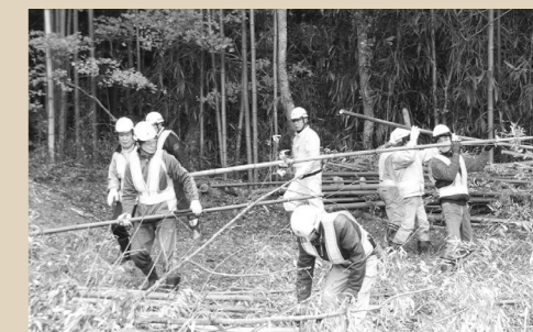
伐採した竹を運び出している様子

本年度は特に、地区内の環境整備事業に力を入れました。日形ジャルダン(旧日形小)・ふるさと公園・下清水地区・割山の環境整備事業には、多くの地区民にご協力をいただき、とてもキレイになりました。竹林完成までもう一歩!これからも、皆さんと力を合わせ、それぞれの事業を推進し、明るく豊かで住みよい日形地区を目指していきます。