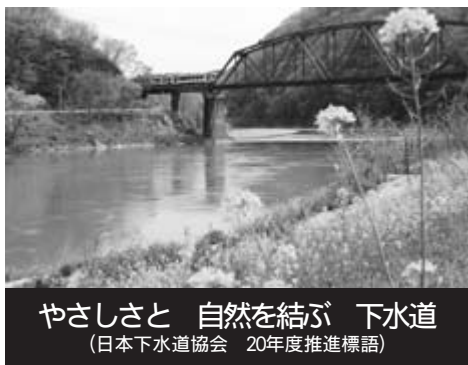
やさしさと自然を結ぶ 下水道 (日本下水道協会 20年度推進標語)

市では、自然と共生する住みよい環境づくりのため、公共下水道の整備を進めています。20年度は、一関・花泉・大東・千厩・東山・川崎地域のうち下表に