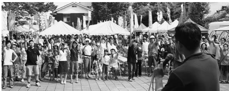
ステージではバンド演奏のほか、じゃんけん大会によるプレゼントも行われ、会場を盛り上げました