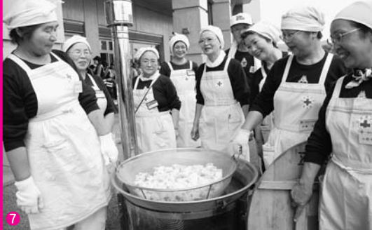
5 県内12の全消防本部が参加し、緊急消防援助隊岩手県隊が倒壊家屋から負傷者を救出・搬送した岩手県緊急消防援助隊訓練 6 千厩町第10区自治会自主防災会が自慢の鉱泉「たまご湯」の足湯をサービス。被災者の気持ちを穏やかにするセラピューティックケア体験訓練 7 赤十字奉仕団などが炊き出しを行った応急食料炊き出し訓練 8 げいび幼稚園児も同園で避難訓練を行った