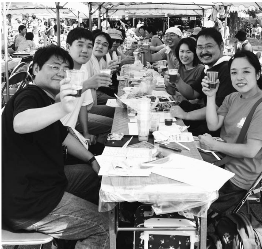
色も味わいもバラエティ豊かな地ビールを飲み比べ、会話が笑顔も弾みます

れたという東京の男性（31）は「これほどの規模は全国最大級。いろいろな中から自分好みの味を見つけるのも楽しみ」と語り、グループの前にはコップの山が築き上げられていました。