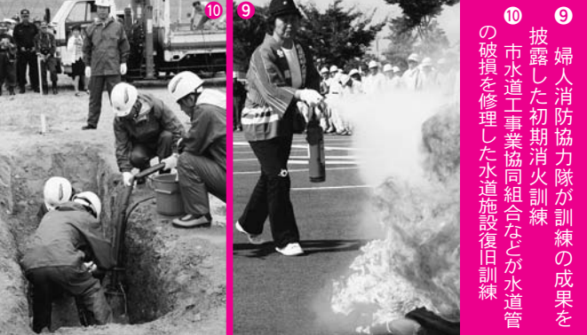
9 10 9 婦人消防協力隊が訓練の成果を披露した初期消火訓練 市水道工事業者協同組合などが水道管の破損を修理した水道施設復旧訓練

18年度総合防災訓練(県・一関市主催)は「防災の日」の9月1日、狐禅寺の総合体育館や北上川学習交流館「あいぼーと」を主会場に行われました。