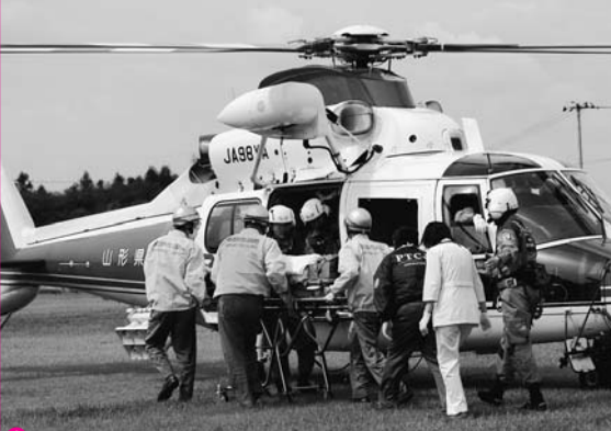
1 山形県消防防災航空隊などのヘリコプターで磐井病院まで重傷者を緊急搬送した負傷者搬送訓練

いざ災害が起こったとき、あわてずに行動できるかどうかは、日ごろの訓練あるのみ。大規模災害を想定し関係機関、地域住民、企業など約1万5千人が参加した岩手県総合防災訓練の現場をレポートします。