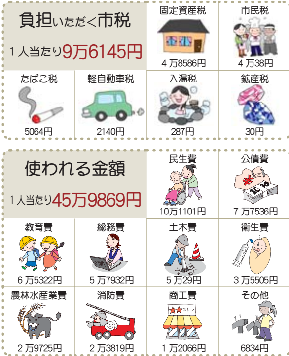
図3 ■市民一人当たりで見た一般会計の予算