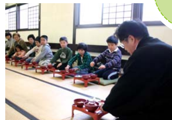
もち本膳で小笠原流の作法を学んだ子どもたち