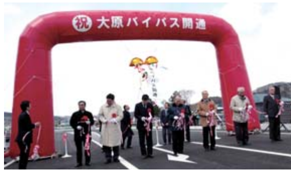
出席者代表がテープカット、くす玉開披を行い開通を祝いました