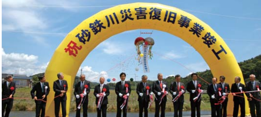
竣工を祝ってテープカットを行う関係者

大東町大原上内野地区を源流とし、東山町中心部を経て川崎町薄衣地内で北上川と合流する延長約45キロメートルの北上川水系の一級河川で岩手県南を代表する清流。途中に国の名勝「狛鼻溪」がある。アユ釣りができる川としても有名。上流の大東町下内野自治会では、環境保全を目的にカジカの放流や石磨き大会を開催。地域資源としての活用も図られている。河川整備は、下流域について、旧川崎村当時の平成元年から10年度まで一般河川改修事業として63億円が投入された。10年8月の北上川からの逆流などによる洪水被害を受け、11年から16年まで、国直轄で床上浸水対策特別緊急事業(256億円)が実施された。