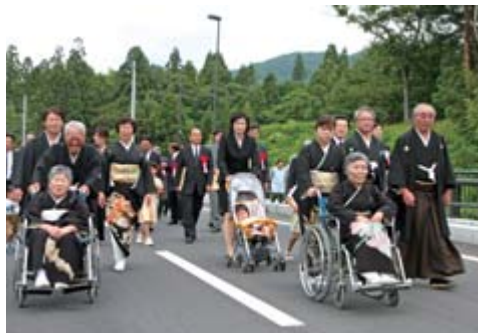
写真資料Ⅱ開通を祝って行われた3代渡り初め(上)、一関北上線開通整備区間(右)

冠水対策事業は、一般県道薄衣舞川線の千歳トンネルから平泉町下平までの4430畝の区間で、平成9年に起工した薄衣舞川線の2000畝は開通済。接続する一関北上線の2150畝が今回、開通しました。事業は平泉町分の280畝を残していますが、21年度内完成の見込みです。総事業費は約102億円です。