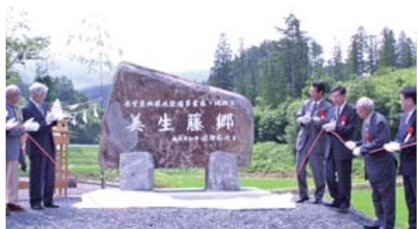
竣工を祝って記念碑を除幕する関係者

大東町大原の藤ヶ崎地区で実施していた県営農地環境整備事業が完工し7月5日、現地記念碑の除幕式が催されました。同事業は、16・7畝の面的整備工事では場の区画整理11・1畝と農作業道3987畝および用排水路5591畝の築造を行うため、平成14年に県営事業として採択され、16年10月に起工、