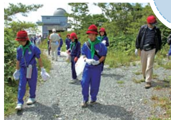
目を凝らしてごみを拾い集める参加者