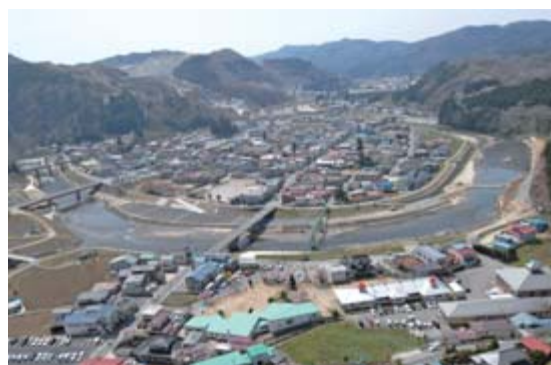
被災直後の東山町内(上)と災害復旧事業竣工後の様子