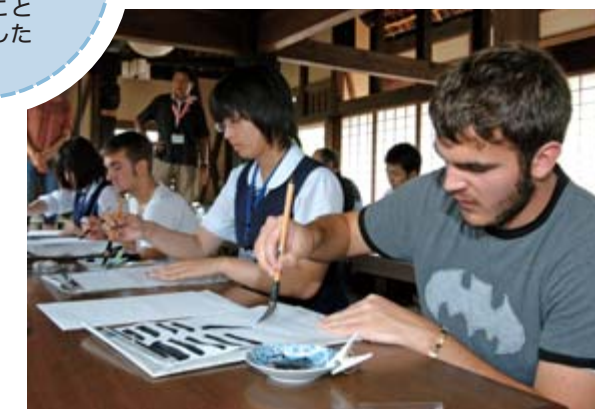
初めての書道に戸惑いながらも楽しんだロータリーの翼参加者

室根山観光協会による室根高原クリーン作戦は7月31日、室根山自然愛護少年団と室根西自然愛護少年団、千厩町観光協会員ら120人が参加し行われました。観光シーズンの最中、観光客に気持ちよく訪れていただけるようにとの願いから例年行っているもの。ごみ袋を片手に蟻塚公園から山頂周辺を3コースに分かれ、歩きながら沿道などに捨てられた空缶などのごみを拾い集めました。約1時間半の作業で、集められたごみの量は少なく、参加者らは室根山がきれいに保たれていることを実感していました。