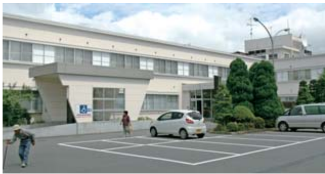
医療体制が課題となっている花泉診療センター