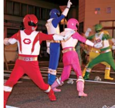
写真資料=地域を活性化するためにやってきたゲイビマン 7月11日 千夜夜市

市は市民同士の活動と活力ある地域づくりを支援するため助成を行う「地域おこし事業」に、