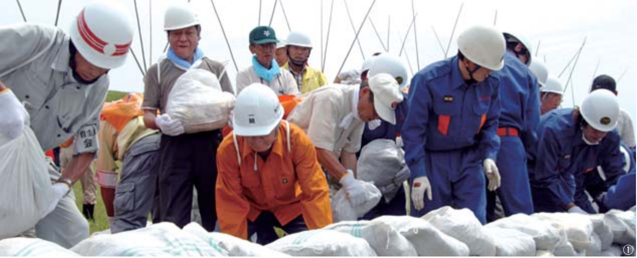
21年度市水防訓練は7月12日、水防隊をはじめ、51を数える自主防災組織・水防ボランティア、各種組織・団体や関係機関、約750人が参加して、狐禅寺の遊水地周囲で行われました。