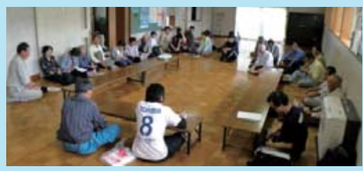
丑石・市ノ通自治会の地域おこし委員会

うとの結論に。そして両自治会は、本年度の市地域おこし事業に申請採択を受けて「遠足は、よもぎ山事業に取り組んでいます。コーディネーターを交えた地域の話し合いは7月までに12回。当初は「何をやらされるのか」と不安な面々でしたが、回を重ねて意識が高まってきていて、今後の活動が楽しみです。