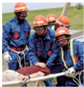
被災者を救出・搬送する市消防団機動部隊