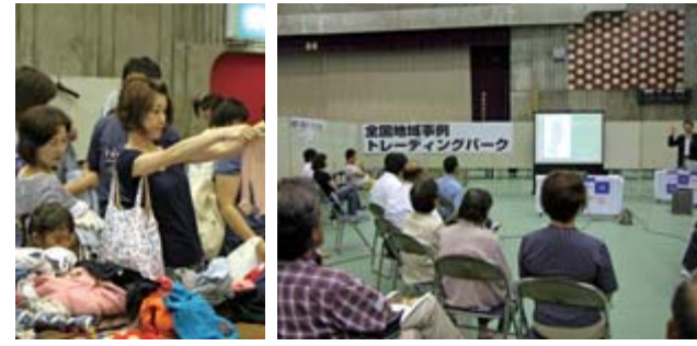
上 作り方を教わりながらバルーンアートに挑戦しました 下左 開幕から大勢の来場者でにぎわった子ども服無料交換会 下右 14団体が参加した全国地域事例トレーニングパーク