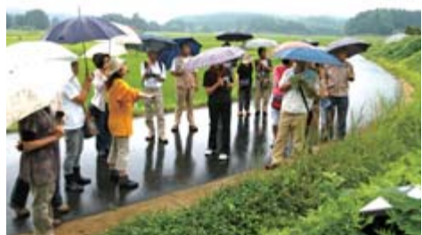
本寺地区内を散策したオープンツアー参加者

休憩所の開所を記念したツアーは7月18日から26日までの土曜・日曜の4日間、催され、43人の参加者が骨寺村莊園遺跡内を散策し理解を深めました。初回の18日には20人が参加。休憩所を出発した一行はまず駒形根神社へ。境内から農家の周りにイグネ、畑や水田が広がる